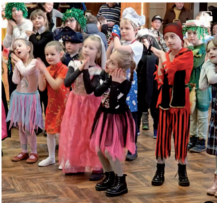
Karneval v Kulturním domě v Malečově.