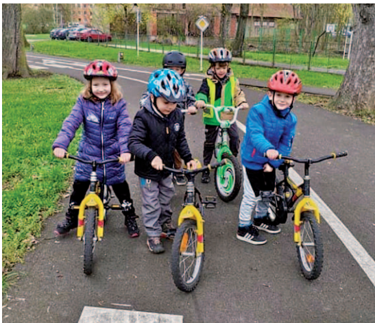
Dopravní hřiště v Ústí nad Labem.