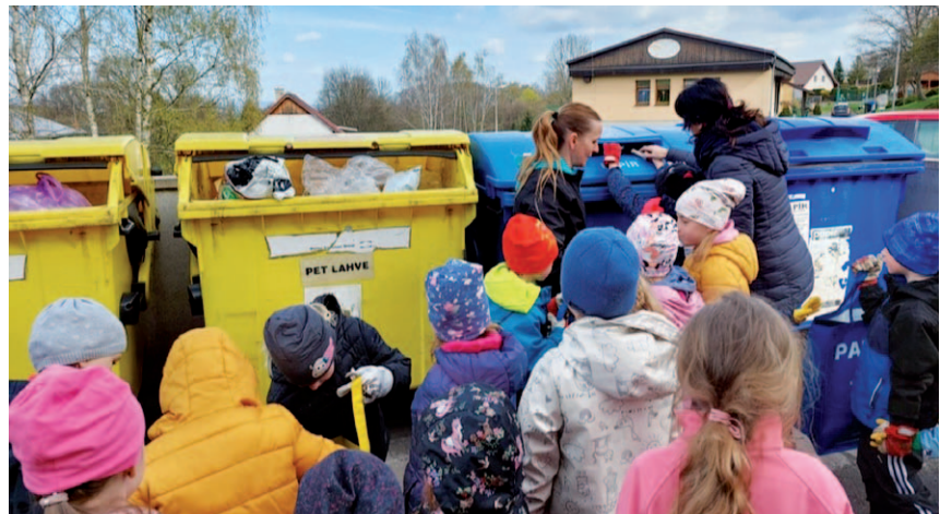
Projekt Den Země ve spolupráci s první třídou základní školy.