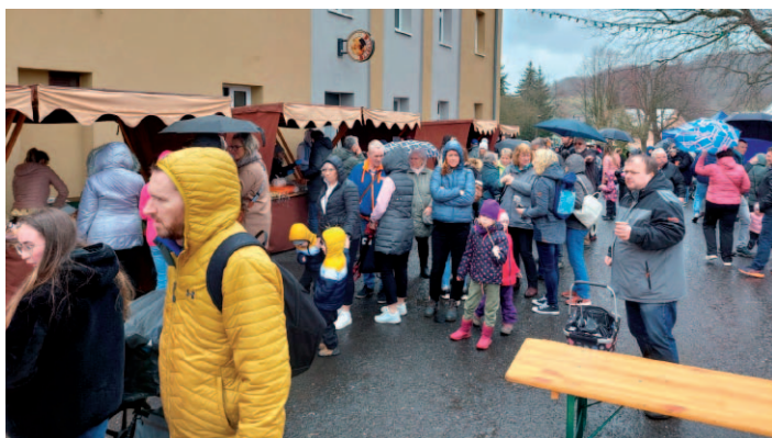
Nevídné počasí návštěvníky velikonočních trhů neodradilo.