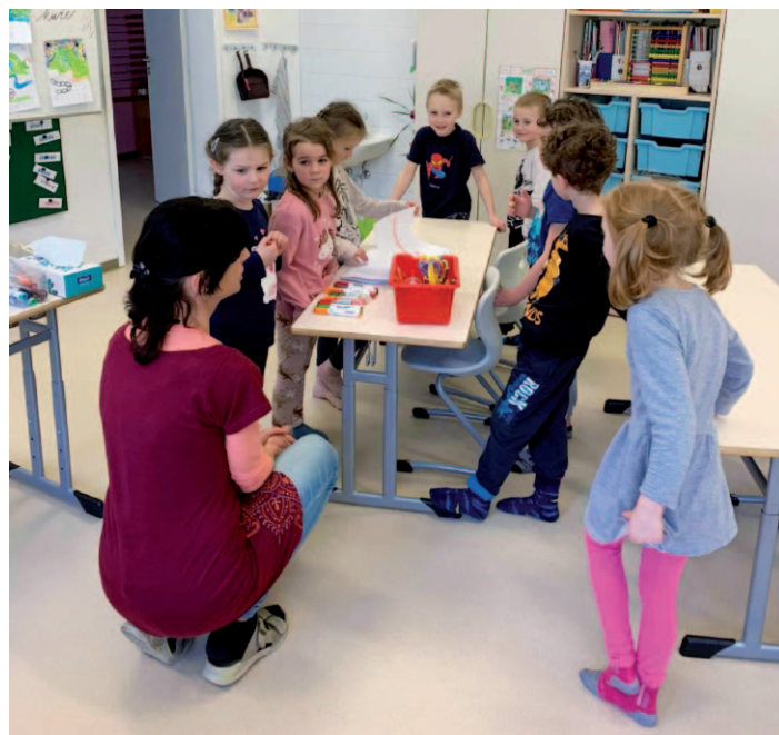
Projekt Předškoláci v první třídě.