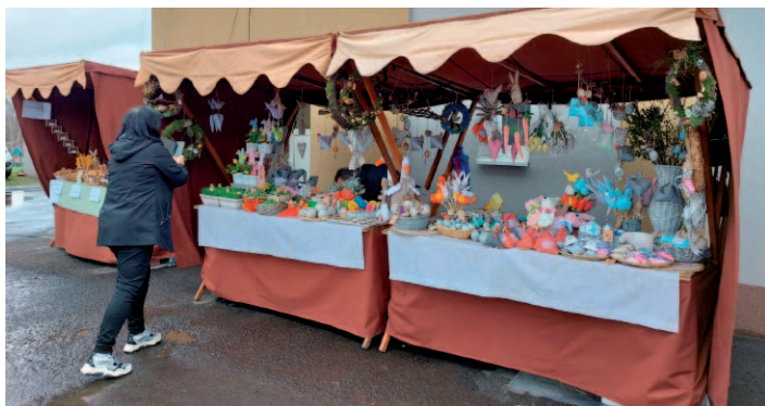
Stánkový prodej na velikonočních trzích v Malečově.