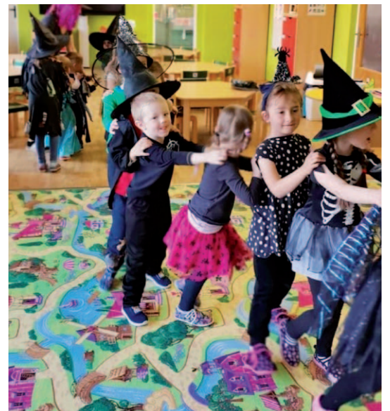
Každoroční „Čarodějnický rej“.