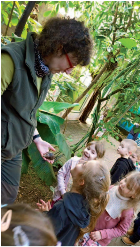
Návštěva BIO parku v Teplicích.