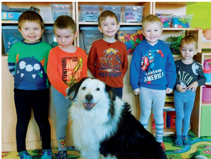
Naši mateřskou školu poctila čtyřnohá návštěva – pes Maxík.