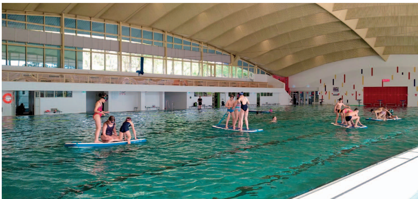
Jako každý rok, i letos jsme s žáky absolvovali pod patronací UJEP v Ústí nad Labem plavecké kurzy.