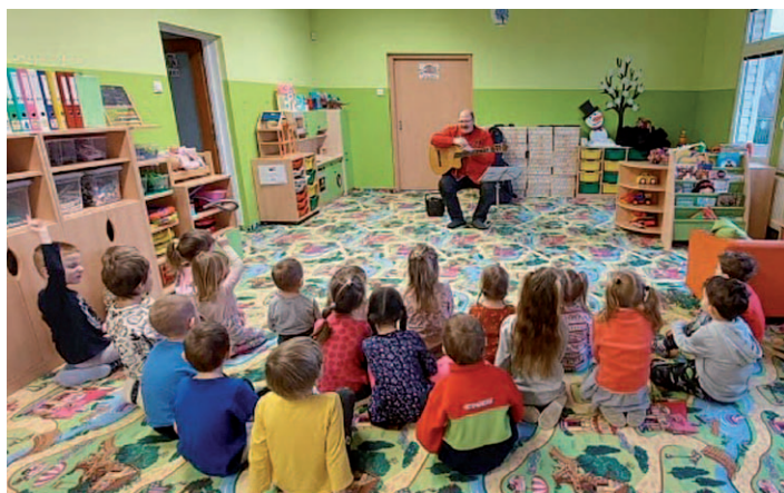
Návštěva kytaristy, který nám zahrál různé žánry na svou kytaru.