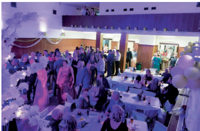
Březnový Reprezační ples v Malečově.