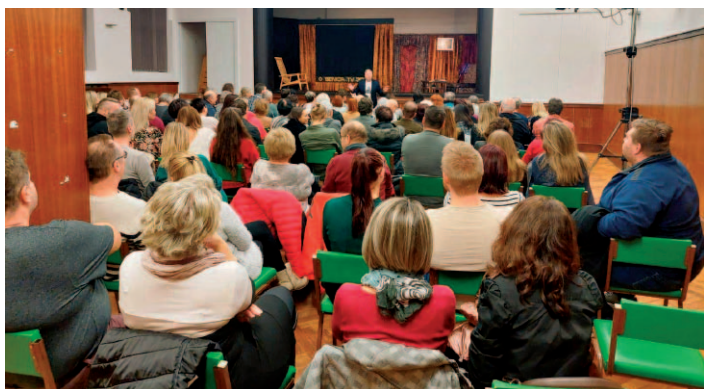
Snímek z divadelního představení „Stáří není pro sraby“.

● Dne 1. dubna 2023 se uskutečnily velikonoční trhy . K poslechu hrála kapela Desperádi, byl připraven stánkový prodej, dětské dílničky a ukázka dobových řemesel. I přes chladné počasí se akce velmi vydařila. Tímto děkujeme všem, kteří se na akci podíleli.