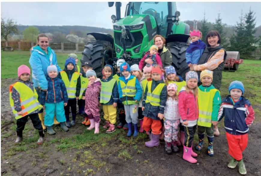
Návštěva místního statku v Březí.