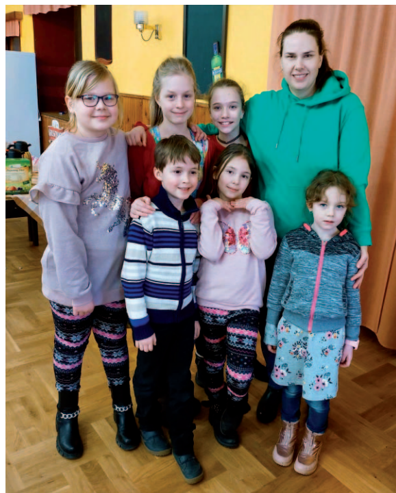
Po školním kole recitační soutěže se vítězové zúčastnili meziškolního klání v petrovické škole.