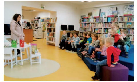
Návštěva ústecké knihovny v ulici W. Churchilla.