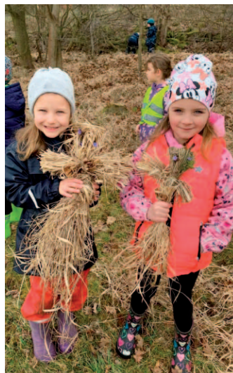
V duchu jarních tradic jsme vynášeli Moranu a vhodili ji do místního potůčku.