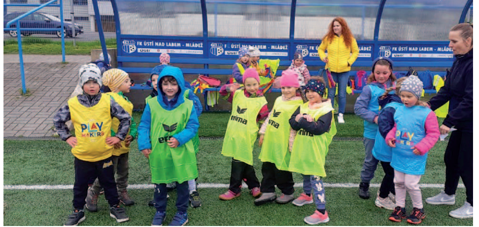
„Fotbalový turnaj“, kde si děti vyzkoušely, jak probíhá fotbal mezi dvěma družstvy.