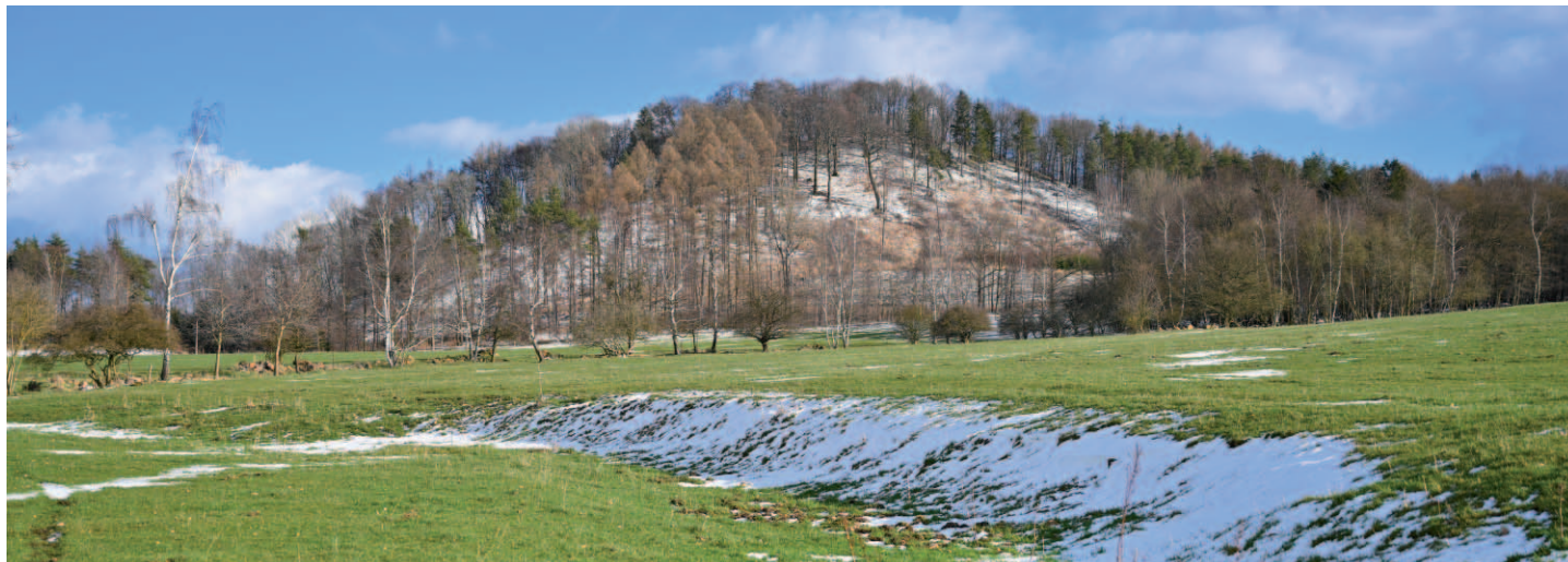
Letošní jarní pohled na Spálený vrch od pastvin u Tašova. Kolem Spáleného vrchu vede silnice do Čeřeniště.