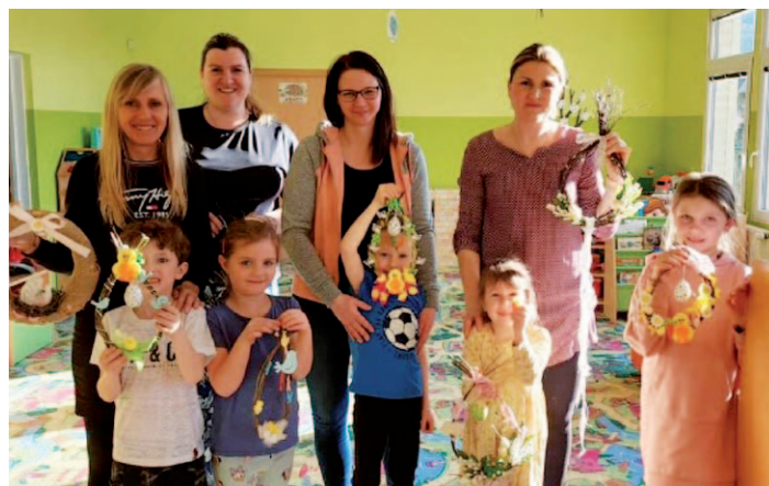
„Šikulkové“, kdy rodiče, děti a učitelky společně tvoří.