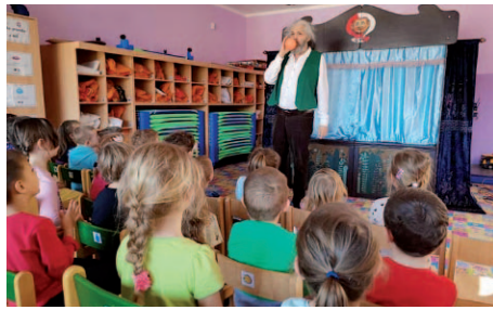
Svátovo divadlo (neboli Svátovo divadlo).