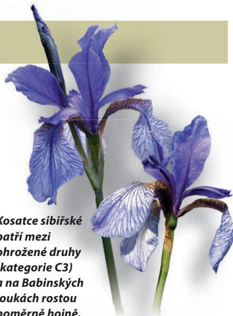
Kosatce sibiřské patří mezi ohrožené druhy (kategorie C3) a na Babinských loukách rostou poměrně hojně.

Jižně od Tašova a v blízkosti obce Čeřeníš- tě se pak rozkládá přírodní památka Babinské louky. Toto území bylo kdysi vojenským pro- storem, občas proto narazíme na betonové protitankové zátarasy nebo na zbytky oko- pů. Lokalita je chráněna pro bohatý výskyt vzácných druhů rostlin, především orchidejí. V severních podmáčených částech luk se brzy na jaře objevují bohaté porosty žlutě kve- toucího blatouchu bahenního, o něco později rozkvetou stovky exemplářů krásné orchideje prstnatce májového a atraktivní žluté kulovité květy upolínů. Rozkvétají zde také bohaté porosty vzácného kosatce sibiřského a v cent- rální části luk nalezneme i několik exemplářů