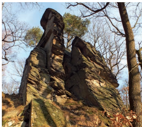
Skalní útvar Tašovských skal zvaný Tašovská hradba (fotografie vlevo). Jedním z nejzají- mavějších skalních útvarů Tašovských skal je znělcový blok rozdělený hlubokou průřvou, který má název ukrytý v řetězovce (fotografie vpravo).