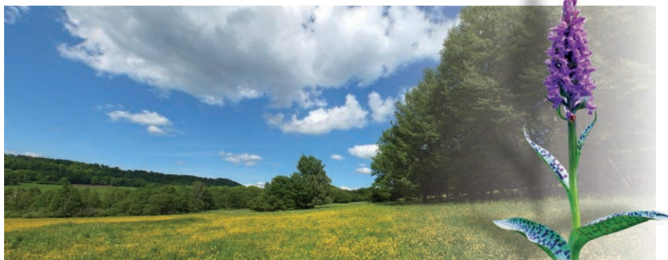
Panoramatický pohled na přírodní památku Babinské louky. Orchidej prstnatec májový.