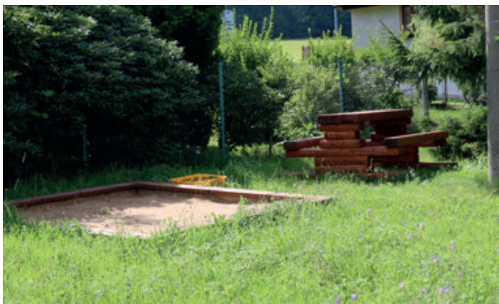
Dětský koutek v Probošově