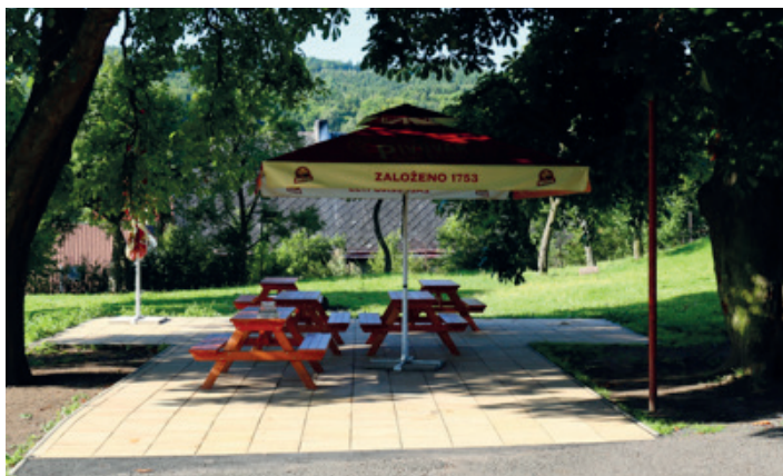
Nové sezení před hostincem v Malečově