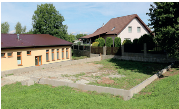
Zahajovací práce na hřišti pro ZŠ a MŠ v Malečově