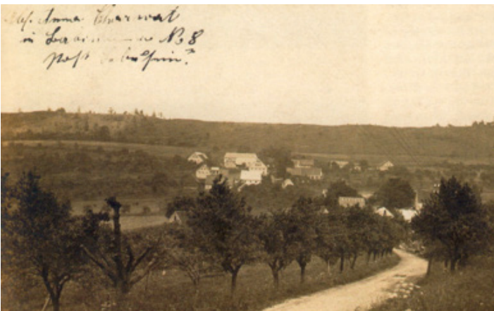
Pohled od Lbína směrem na Babiny

Historie Babin sahá ke konci 12. století, kdy byly součástí královského majetku. Později patřily klášteru augustiniánů v Roudnici nad Labem a v roce 1399 je získal Jan z Kamýka. Od 16. století ves náležela libešickému panství. V roce 1630 ves získala litoměřická jezuitská kolej a po zrušení jezuitského řádu připadla královské komoře. Nejvíce obyvatel, převážně německé národnosti, zde žilo v roce 1869 a to okolo 170. Později počet obyvatel klesal. Život v této vysoce položené vsi nebyl jednoduchý. Obyvatelé se živili převážně zemědělstvím. Děti docházely do školy v Čeřeníšti. K zá-