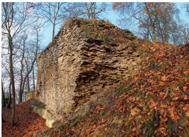
Mohutné zdivo paláce hradu Lityš.