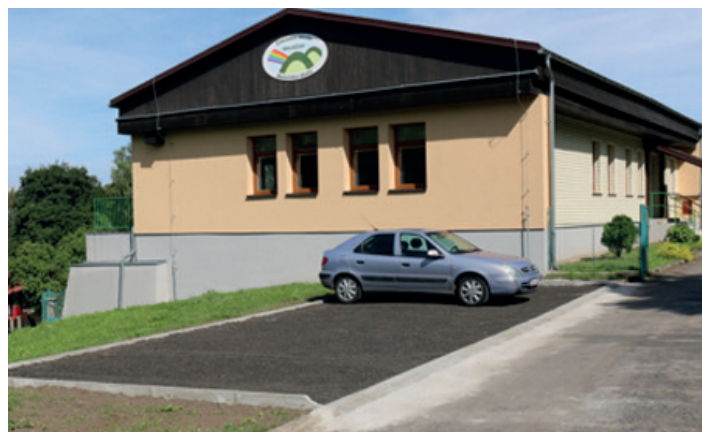
Nová parkovací místa pro ZŠ a MŠ v Malečově