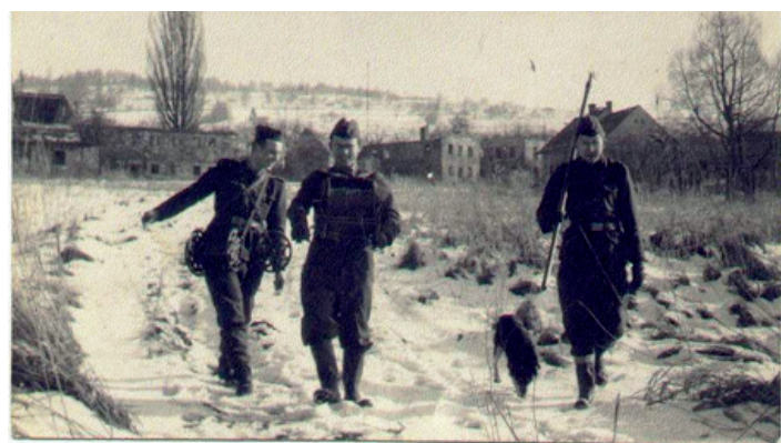
Vojáci v prostoru babinské louky (1961-1962)