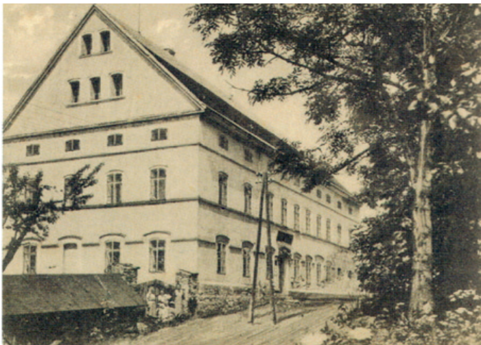
Zimmerlerův hostinec v Babínách

Babiny (německy Babina) jsou zaniklou osadou, která se nacházela v oblasti mezi křižovatkou Tašov–Ovčárna směrem k Čeřeníšti, v podstatě až k současné autobusové zastávce v Čeřeníšti, ale také až k hranici litoměřického okresu před Lbínem. Jednalo se o jednu z vysoko položených obcí – 550 m n. m. Obec se nacházela pod Babinským vrchem s nadmořskou výškou 626 m.