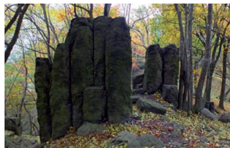
Mohutné sloupce trachybazaltu na Sedle.