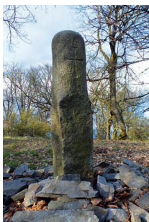
Křížový sloup na Sedle.