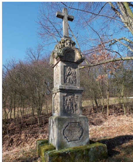
Boží muka u Horních Zálezel