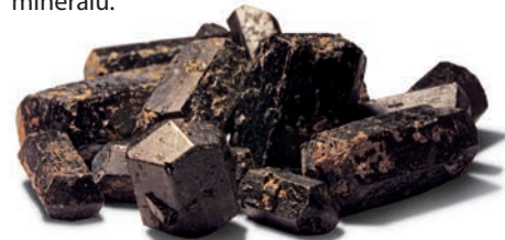
Augity a amfiboly ze Sulečic.

V lesích jižně od Sulečic se pak nachází bohaté naleziště volných černých krystalů augitů a amfibolů, které vyhledávají sběratelé minerálů.