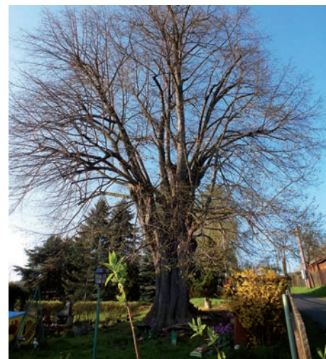
Památná lípa v Sulečicích.

Skalní útvar se dokonce dělí na vodorovné sloupce, které vypadají jako opravdové cihly. Obyvatelé si kdysi mysleli, že takové mohutné černé zdi mohl postavit jenom čert. Sulečická Čertova zeď je zmenšenou obdobou národní přírodní památky Čertova zeď u Osečné v Libereckém kraji. Při jižním okraji Sulečic, asi sto metrů od centra obce, stojí jedinečná barokní nika s motivem Zmrtvýchvstání Krista.