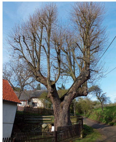
Památná lípa v Býňově.