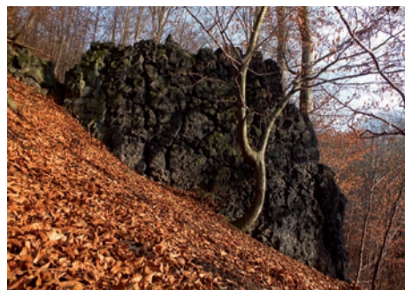
Pozoruhodná Čertova zeď u Sulečic.

V okolí Sulečic, především na loukách severovýchodně od Berandu, na podzim bohatě kvetou ocúny. Nad údolím potoka, asi 650 metrů severovýchodně od Berandu, se nachází pozoruhodný geologický útvar zvaný Čertova zeď u Sulečic. Jde o odolnou čedičovou žilnou horninu. Útvar vznikl tak, že v době vulkanické činnosti pronikalo žhavé čedičové magma puklinami skrze již utuhlé starší horniny, které však měly menší hustotu a snáze podléhaly zvětvávání. Díky tomu odolná žilná hornina vystoupila ze svahu v podobě tajemné zdi.