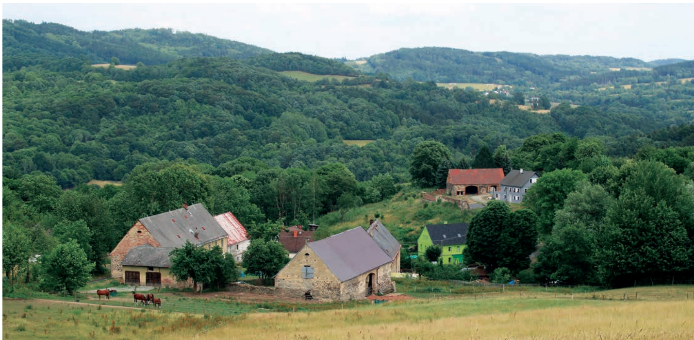
Celkový pohled na Horní Zálezly

Horní Zálezly (německy Salesel), obec s nadmořskou výškou 361 m je od 1. 7. 1980 částí obce Malečov, v letech 1961 – 1980 spadala pod Tašov, v období 1869 – 1930 obec pod názvem Zálezly spadala do litoměřického okresu. Jiný zdroj uvádí, že pod okres Ústí nad Labem obec přešla v roce 1950.