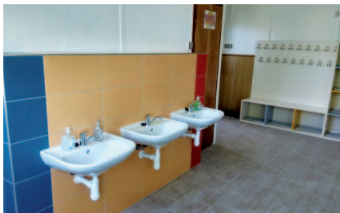
Šatna školní jídelny.

V průběhu léta byla provedena úprava prostor šatny školní jídelny a hygienického zázemí pro zaměstnance. Tato investice byla možná jen díky výborné spolupráci se zřizovatelem – OÚ Malečov.