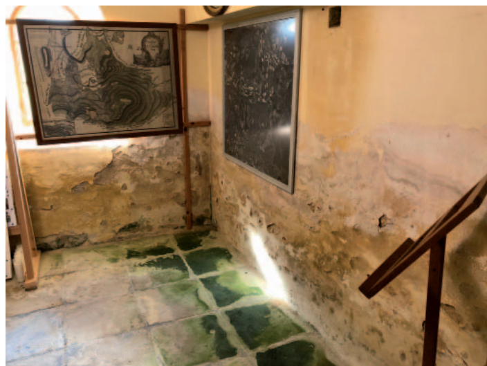
Vlhkostí zřetelně narušené zdivo v prostoru zákristie.