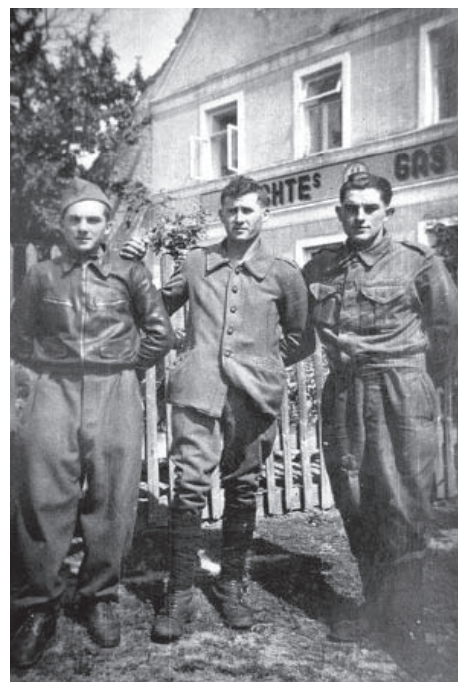
Hostinec v Řetouni.

Slámovou, muži kříž vzali a společně ho ještě ten večer usadili zpět na místo. Pokud až do současnosti nikdo kříž neopravoval, zdá se, že svou práci odvedli moji prarodiče dobře, neboť kříž na svém místě vydržel další 70 let!