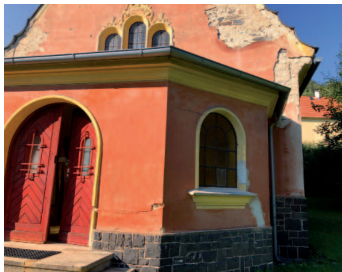
Pohled na současný stav fasády kostela.