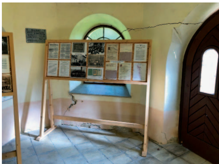
Viditelné praskliny ve zdivu vstupní části kostela.