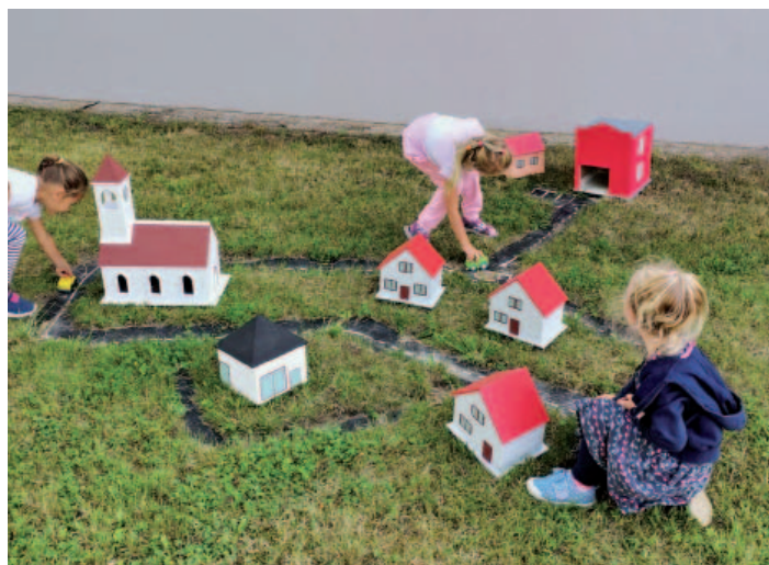
Předškolní děti mají k dispozici řadu pěkných venkovních hraček.

vylepšily a vyzdobily vnitřní prostory MŠ. Paní učitelky připravovaly pro děti ze školky pracovní listy. Učitelé se vzdělávali na dálku prostřednictvím různých online seminářů.