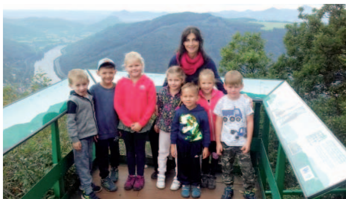
Prvňáčci na vrcholovém ochozu rozhledny na Vysokém Ostrém.

prostředí, a je také připravena pomoci žákům, kteří nemají potřebné vybavení.