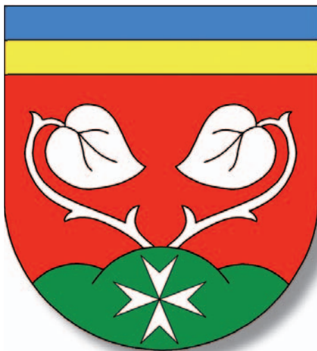
Obyvatelé Malečova vybrali nový znak obce.