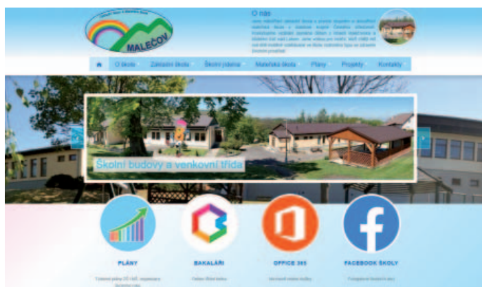
Nový školní web www.zsmalecov.cz .

Během prázdnin jsme vytvořili nový školní web. Adresa zůstává stejná: www.zsmalecov.cz .