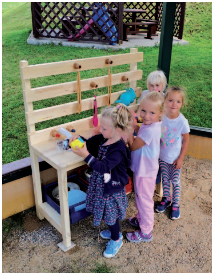
Venkovní herní prvky a zázemí pro děti v mateřské škole.

I nás obtížná situace popostrčila k zavádění nových prvků a forem do výuky a způsobu hodnocení, na jejichž aplikaci v běžném režimu nezbyval čas ani síly. Období nepřítomnosti dětí využily také paní učitelky ve školce, aby vytvořily nové herní prvky ve školní zahradě (pocitový chodník, kuličková dráha, silnice s městečkem, kuchyňka), a také