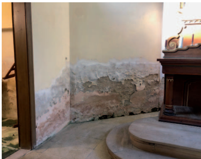
Prostor za oltářem.