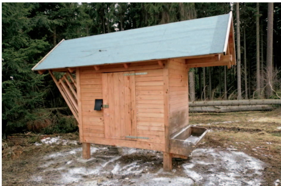
Ukázka sanace krmelců.

V měsíci květnu nám začal odlov srnců a v dalším období odlov zvěře mufloní a dančí. Divočáci se samozřejmě loví po celý rok. V září začneme přikrmovat zvěř jádrem, především ovsem, který je nejvhodnější.