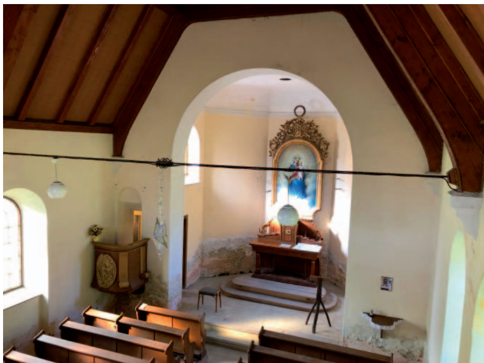
Celkový pohled na špatný stav zdiva způsobený vlhkostí – interiér kostela Panny Marie Pomocnice křesťanů v Čerěníšti.

Zdeněk Petr, Radek Antoš (kostel Čerěníště)