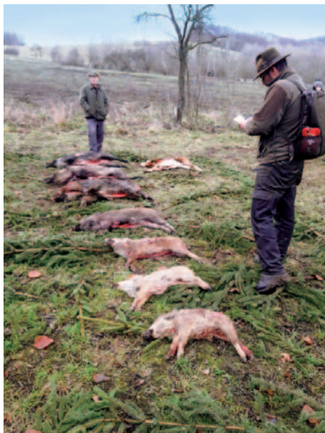
Výřad po společném honu.

Vážení občané Malečovska, v posledním článku jsem zmínil, že nám končí myslivecký rok na konci března a že budeme svoji práci hodnotit na výroční schůzi v dubnu. K tomu už však nedošlo z důvodu koronaviru. Naše činnost nebyla výrazně ohrožena, pouze jsme se nesměli scházet na členských schůzích a na veterinární správě jsme museli dodržovat nařízené opatření. V odlovu jsme omezeni rovněž nebyli.