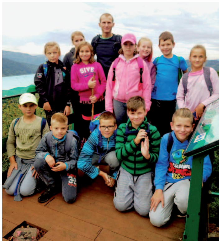
Společná fotka školáků na vrcholu Vysokého Ostrého.

Pro tento školní rok máme v plánu zimní školu v přírodě spojenou s lyžováním, výuku plavání ve spolupráci s UJEP a letní školu v přírodě. Naplánováno máme celou řadu akcí v rámci preventivního programu, vzdělávacích programů, projektů a výletů. A to jak pro žáky ze školy, tak děti ze školky.