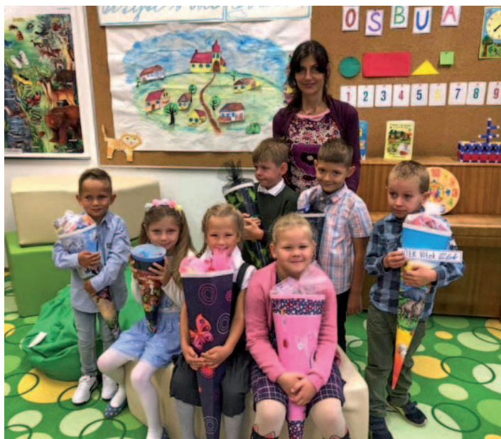
Sedm nových prvňáčků.

Nový školní rok jsme zahájili bez větších omezení a doufáme, že se nám případné významné komplikace, spojené s epidemiologickou situací, vyhnou. Pokud by nastala nutnost distanční výuky, má škola nachystanou jednotnou platformu pro komunikaci se žáky v online