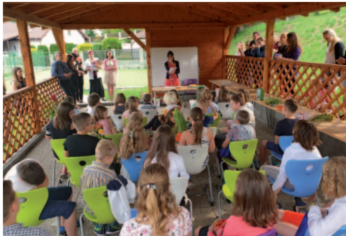
Snímek z předávání vysvědčení žákům naší školy.

Po komplikacích, které všem na jaře způsobila epidemie covid-19, se na konci května vrátili děti do školy i školky a výuka probíhala za zvýšených hygienických opatření. Distanční výuka byla náročná pro žáky, jejich rodiče i učitele, a všichni uvítali návrat do školy. Jsme rádi, že si školáci mohli převzít vysvědčení osobně. Žáci k vysvědčení obdrželi slovní hodnocení a tohoto trendu se škola bude držet i do budoucna.