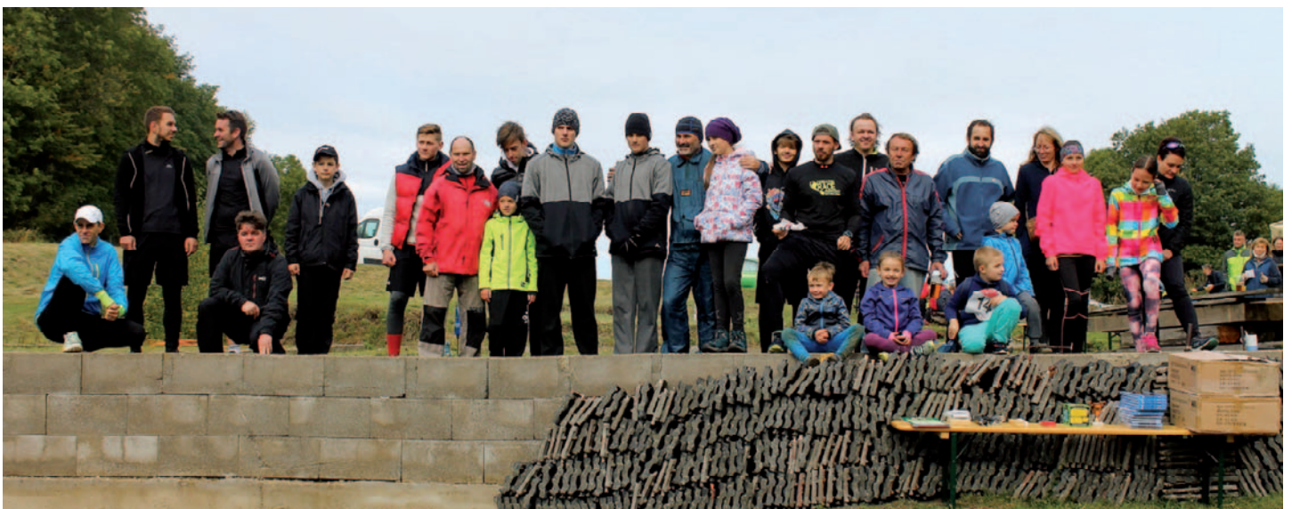
Společná fotografie po vyhlášení vítězů.