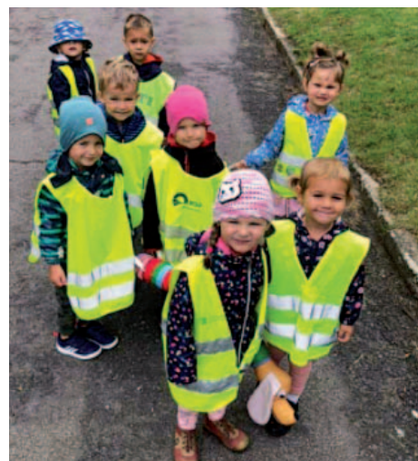
Důležitý je pobyt na čerstvém vzduchu.