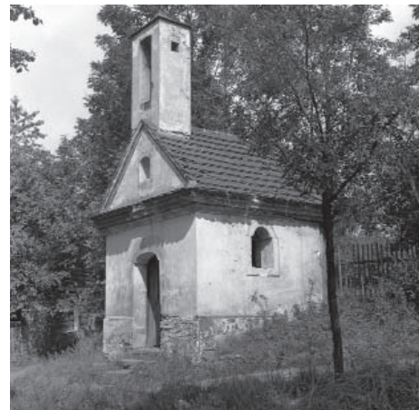
Věděl by někdo, kde stála tato kaplička?