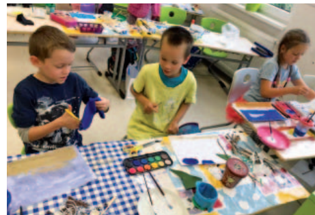
Když jsme ještě mohli tvořit bez roušek.

Naše školka se zapojila do tří projektů. Jedním z projektů jsou „Ježíškova vnučata“, kdy děti vytvořily pro domov důchodců vánoční přáníčka. Do dalšího projektu „Krabice od bot“, se zapojili i rodiče. A nechyběla ani spolupráce s naším obecním úřadem Malečov,