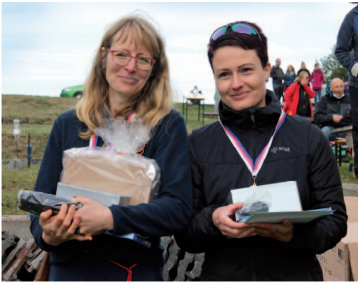
Vyhlášení výsledků – kategorie ženy.