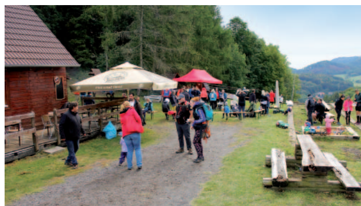
Celkový pohled na prostor pod Lucemburkovým kopcem.

Počasí bylo pro běh ideální, doprovodné slovo a hudba motivující, občerstvení z domácích zdrojů chutné, běžci/běžkyňe (snad) spokojeni. Tak za rok znovu!