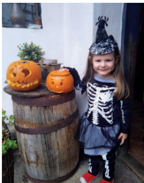
Halloweenské výtvary na dálku.