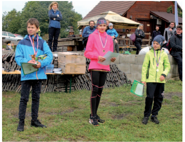
Vyhlášení výsledků – kategorie děti.