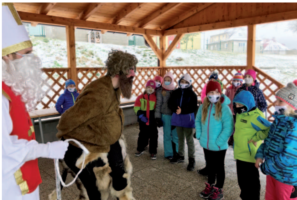
Snímek z prosincové návštěvy Mikuláše a čerta v základní škole.

Touto formou chci velmi poděkovat učitelům, pro které byla distanční výuka časově i psychicky náročná. Stejně tak musím po-