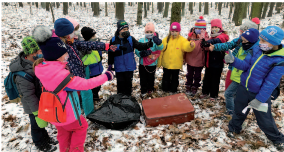
2. a 3. ročník ukončily putování za pokladem.