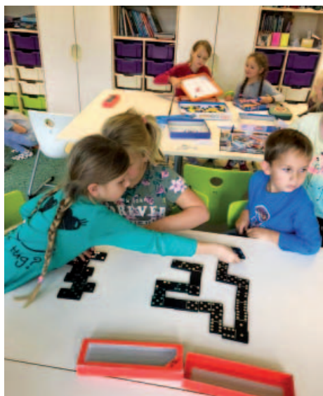
Klub zábavné logiky.