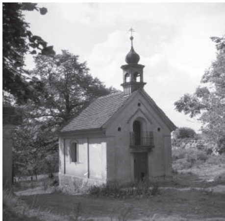
Kaplička v Němčí – snímek z roku 1959.

Při cestě za těmito památkami spolupracujeme s Biskupstvím litoměřickým, Národním památkovým ústavem, Státními oblastními archivy a rovněž jsme oslovili partnery v Německu. Všichni přece víme, kdo stavbu těchto drobných sakrálních památek inicioval. To neznamená, že je necháme zmizet z krajiny.