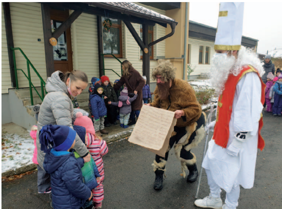
Snímek z prosincové návštěvy Mikuláše a čerta v mateřské škole.

V tomto roce jsme zahájili postupný přechod na slovní hodnocení, které za dva roky nahradí klasické hodnocení známkami na vysvědčení. Přechod na slovní hodnocení a průběžné formativní hodnocení je jeden z hlavních úkolů strategického plánu rozvoje školy, který vám představíme v některém z dalších vydání Listů z Malečovska.