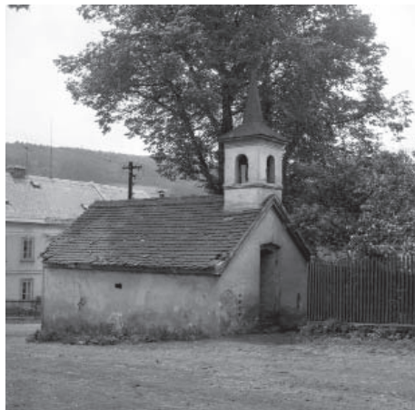
Kaplička v Malečově.