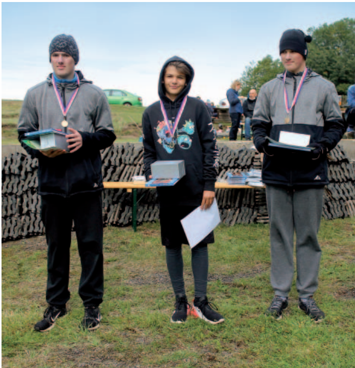
Vyhlášení výsledků – kategorie junioři.