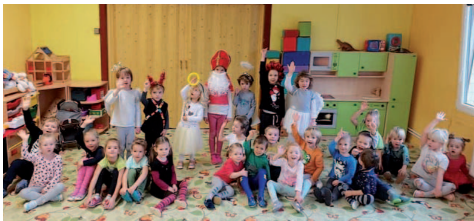
Mikuláš v mateřské škole.