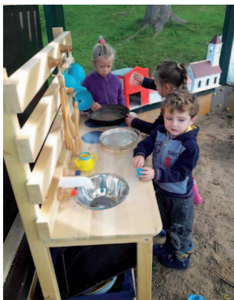
Nová kuchyňka ve školní zahradě.