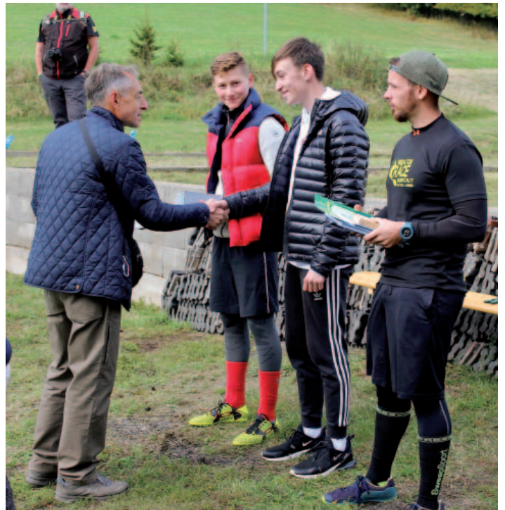
Vyhlášení výsledků – kategorie muži.