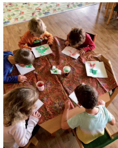
Společné tvoření ve školce.