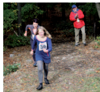
Atmosféra závodu byla skvělá!