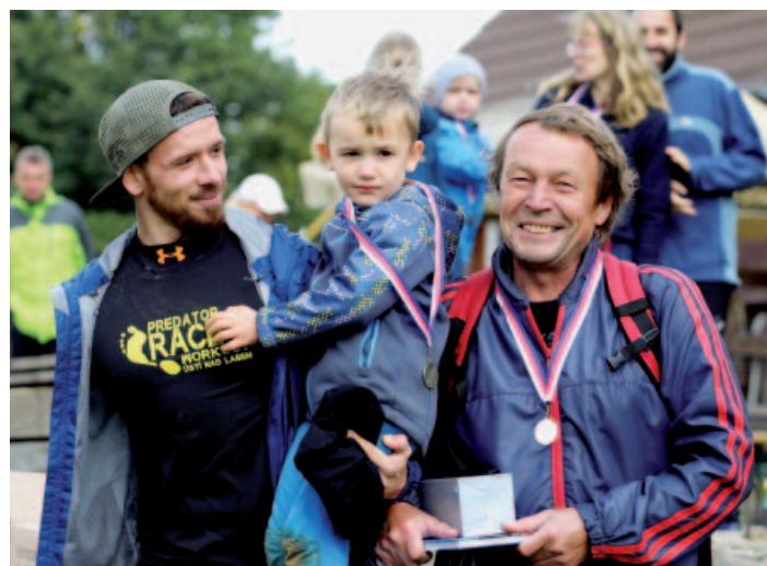
Společná fotografie nejmłodšího a nejstaršího účastníka závodu.