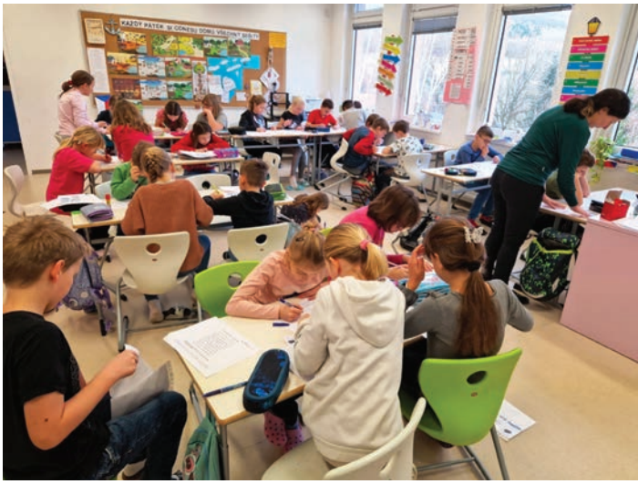
Projektový den v ZŠ – Zimní sporty v angličtině. Všechny týmy pracovaly s nadšením, aby své snažení završily sportovní reportáží, kterou jsme natáčeli na video. Nejenže jsme se pobavili, ale i poučili pro příště.