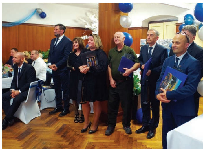
Slavnostní ocenění občanů, kteří se zasloužili o rozvoj obce, se uskutečnilo v rámci Reprezenčního obecního plesu v Malečově.