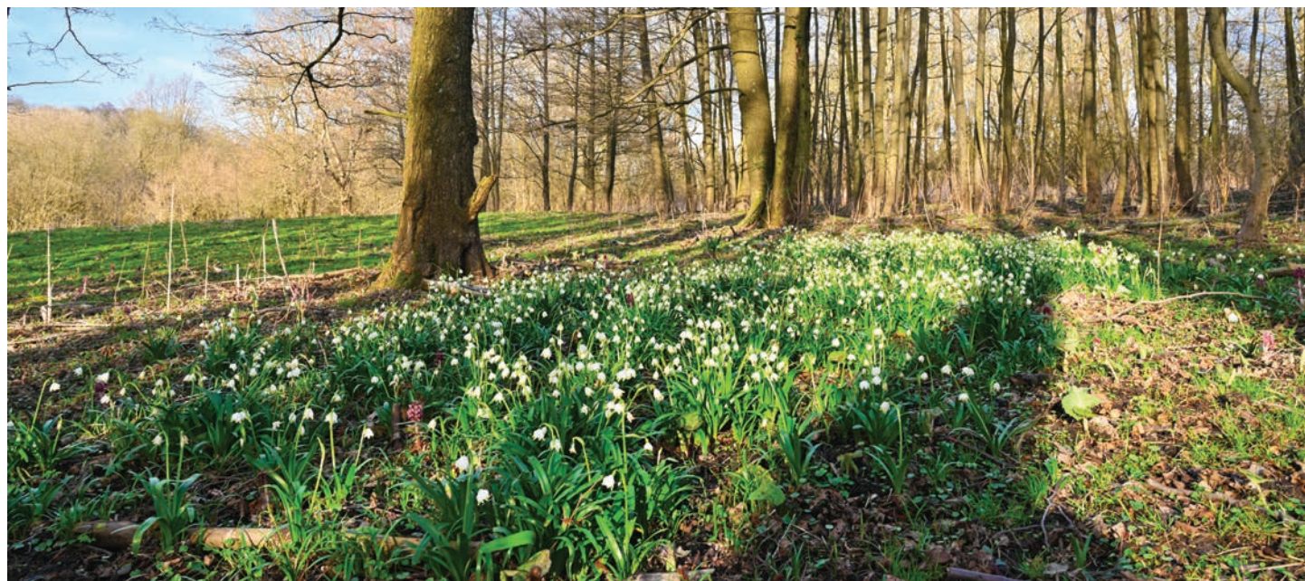
Rozkvétající bledule na Babinských loukách mezi Babinským vrchem (630 m n. m.) a Vrchovinou (677 m n. m.).