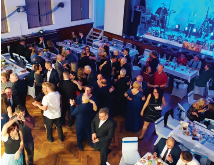
Snímek z Reprezenačního plesu v Malečově.