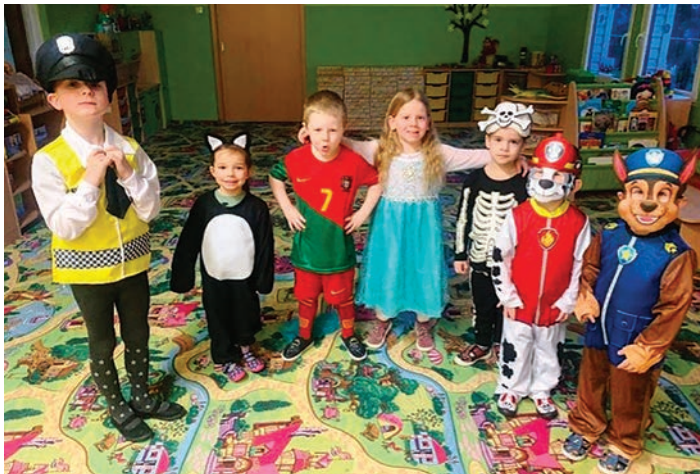
Karneval v mateřské škole.