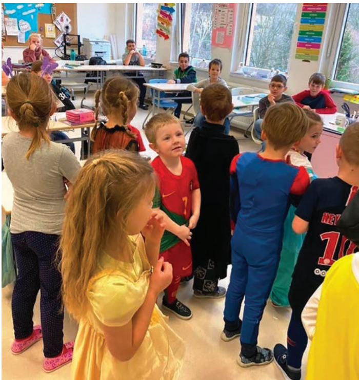
Předškoláci navštívili základní školu, aby si vyzkoušeli, jaké je to sedět v lavici ☺