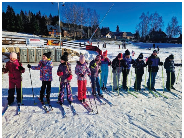
Tradiční zimní škola v přírodě s lyžováním v Bedřichově.

NĚKOLIK POSTŘEHŮ Z NAŠÍ ŠKOLY A ŠKOLKY V OBRAZECH: