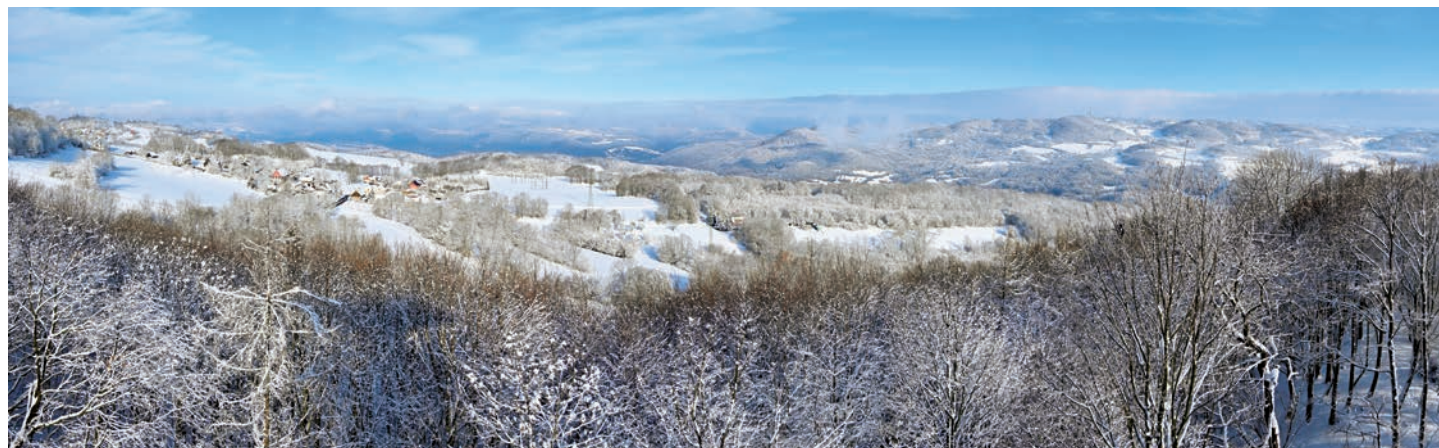
Zimní výhled z rozhledny na Lucemburkově kopci (564 m n. m.) směrem k severovýchodu.