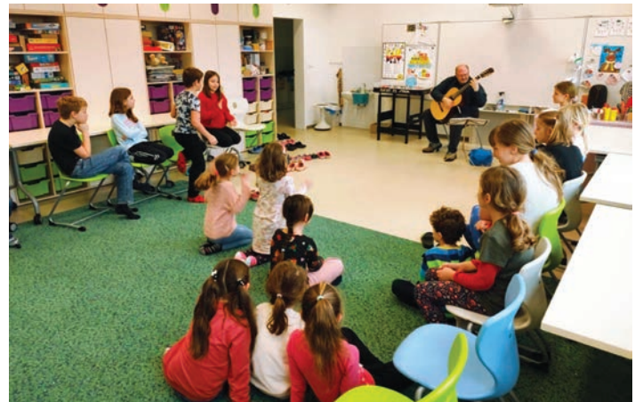
Kytarový koncert v ZŠ i MŠ – na strunách kytary jsme obletěli celý svět, abychom ochutnali jeho rytmy, barvy a vůně.