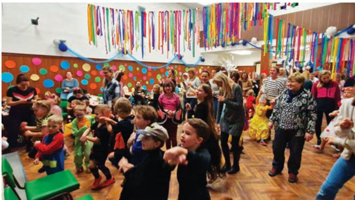
Dětský karneval je velmi oblíbený, o čemž svědčí opravdu bohatá účast dětí a jejich rodičů. Tancovalo se i soutěžilo.