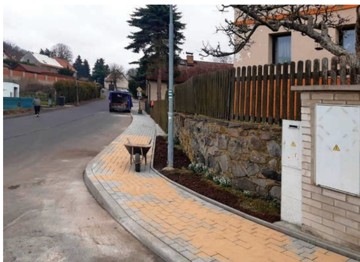
Snímky z rekonstrukce chodníků v Malečově.