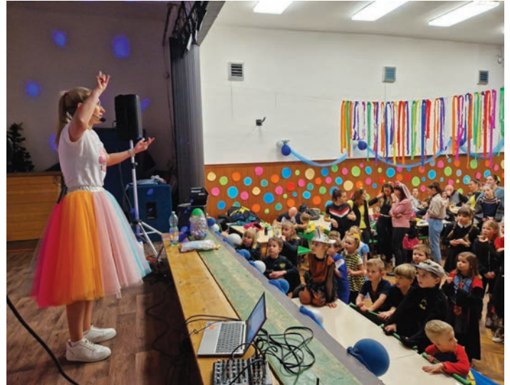
V rámci dětského karnevalu se uskutečnilo také představení.